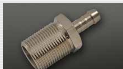
Verdrehsicherung anti-twist protection