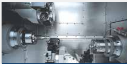
5-Achs-Bearbeitung quint-axial machining