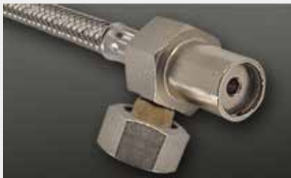
mit Absperrspindel with block spindle