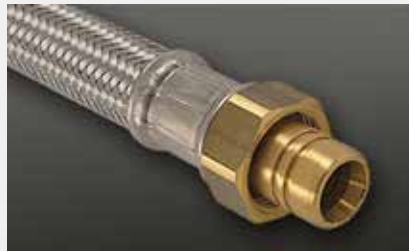
mit Gleitring with bearing ring