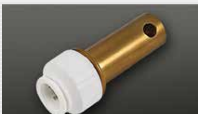
Steckverbinder mit Sicherung connector with lock