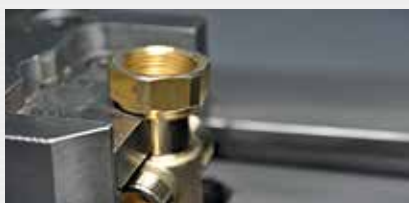
Stauchen / Drücken upsetting / spinning