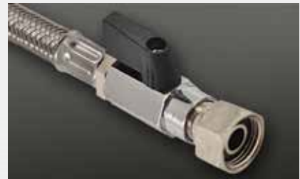
mit Kugelhahn with ball valve