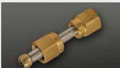
konisch dichtend cone seat