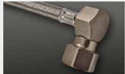
drehbar im Anschluß rotatable fitting