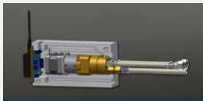
Entwicklung / Konstruktion research and development