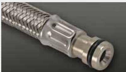
Rohrstutzen Sonderlösung pipe end, special solution