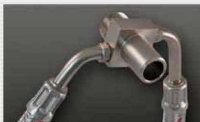
Sanitärverteiler superflach plumbing distributor slim line