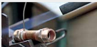
Löten heat treatment