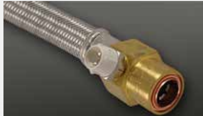
Anschluß Cuprofit mit Entlüftung push fit Cuprofit with air bleeder