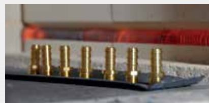
Wärmebehandlung heat treatment