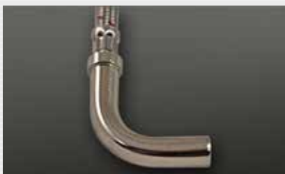
Rohrbogen 90° elbow pipe