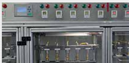
Druckprüfung pressure test