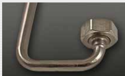
Raumsparbogen 180° compact elbow