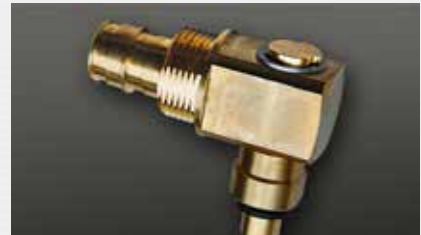
Übergang Presssystem connection to pressing system