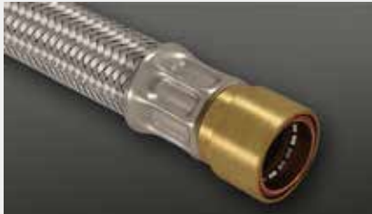
Anschluß Cuprofit push fit Cuprofit