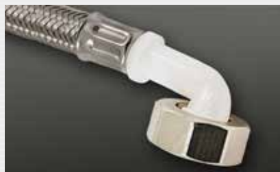
Kunststoffwinkel plastic elbow