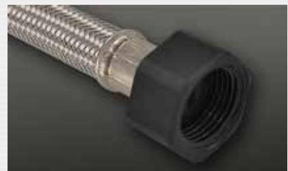
Kunststoffmutter plastic nut