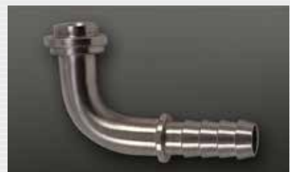
Edelstahlbogen stainless steel elbow