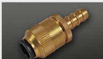
Klemm-Steckverbinder push fit, clampable