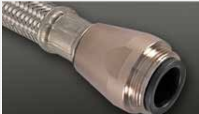
Anschluß John Guest push fit John Guest