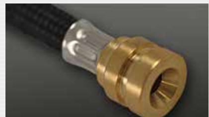
Rohrstutzen Sonderlösung pipe end, special solution