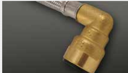
Winkel John Guest push fit elbow John Guest