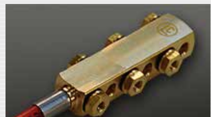
Klemmverschraubung 6-fach compression manifold, sixfold