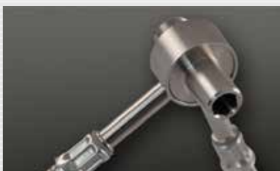
Sanitärverteiler plumbing distributor