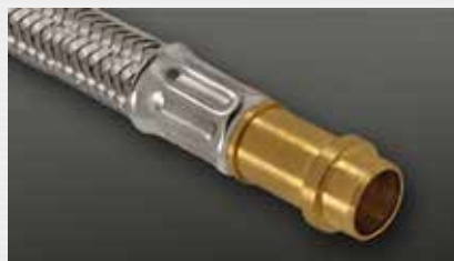
Rohrstutzen Sonderlösung pipe end, special solution