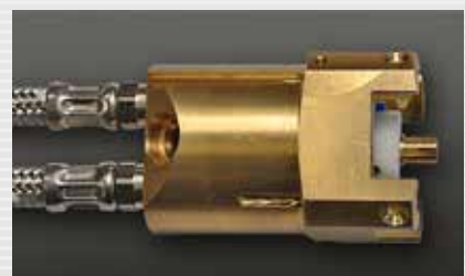
Kartuschenanschluss cartridge connection