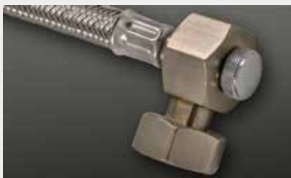
mit Ventilschindel (mini) with valve spindle (mini)