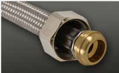
konisch dichtend cone seat