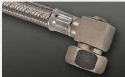
drehbar im Gehäuse rotatable frame