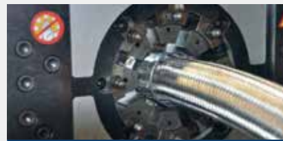
Werkzeugbau tool shop