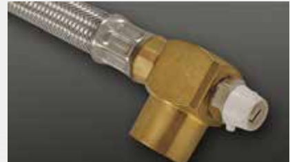
Winkel Cuprofit mit Entlüftung push fit elbow Cuprofit with air bleeder